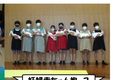
妊婦赤ちゃん抱っこ