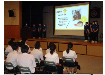
久留米大学院生講話

<学習内容>・当日の流れ確認 ・会場配置、沐浴の仕方・手順・役割分担確認 ・爪切りチェック